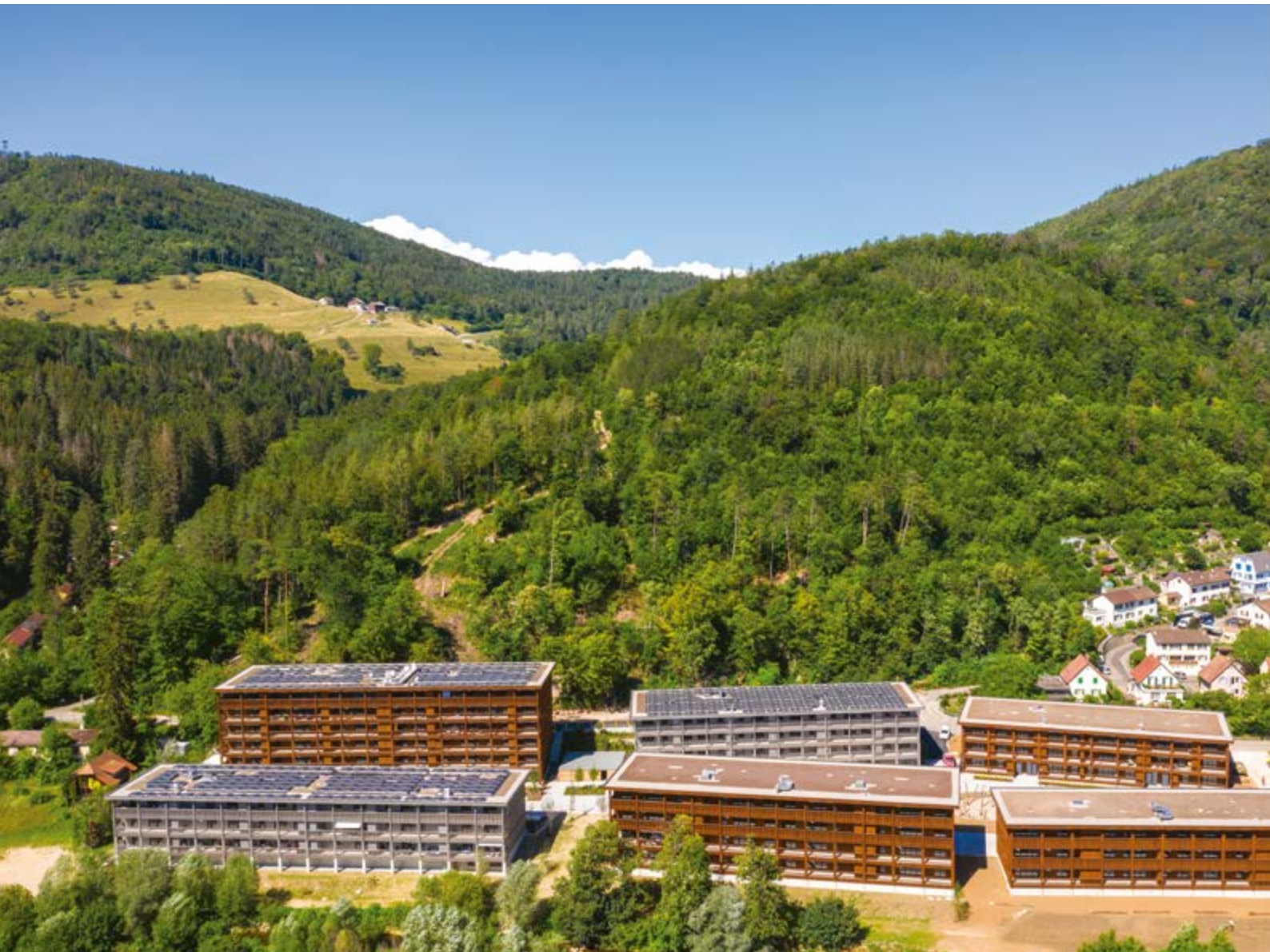
Vue aérienne du quartier durable Weidmatt sur les communes de Liestal et Lausen à Bâle-Campagne