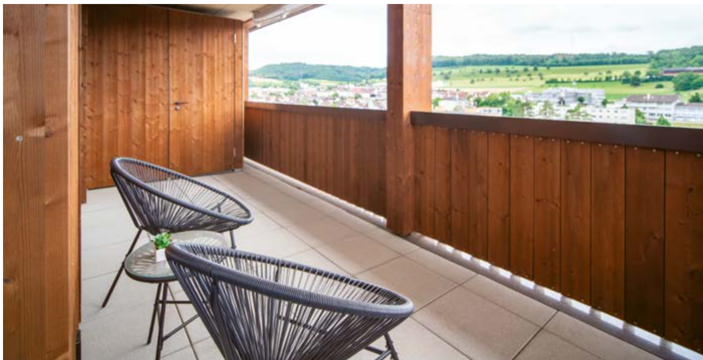
Vue depuis le balcon de l'un des appartements du projet de quartier durable Weidmatt, situé sur les communes de Liestal et Lausen à Bâle-Campagne